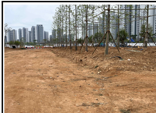
관목식재는 주요활동 공간에 집중배치