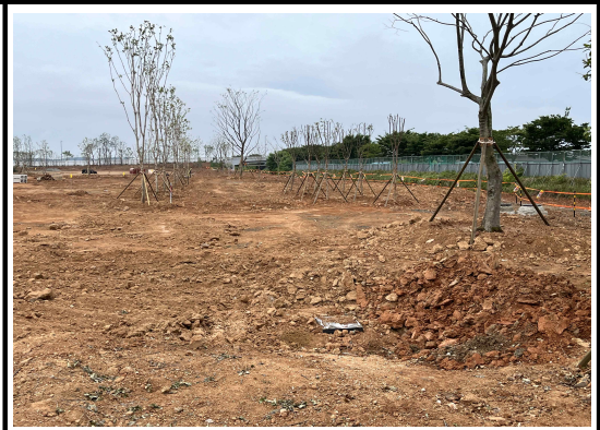
경사를 최대한 낮추어 자연스러움 유지하고 토사유출방지