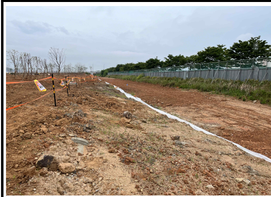
경사처리로 우수한 유출속도를 낮추면서 자연스러운 경관형성