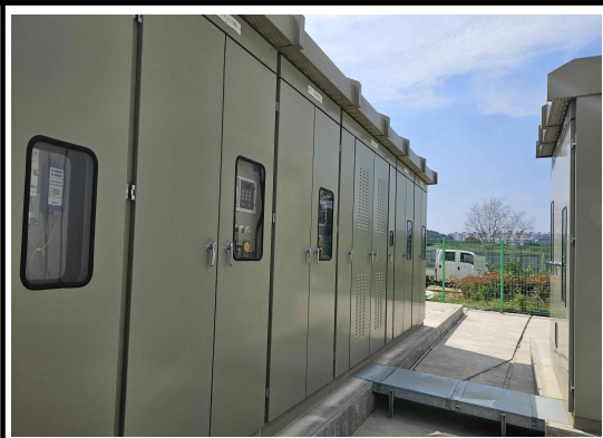
이중시건장치 설치요망 (바람에 의한 보호)