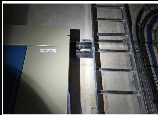
노출 PVC 배관을 Pull BOX로 변경