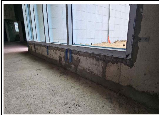
AL창호 하부 고정철물 보강