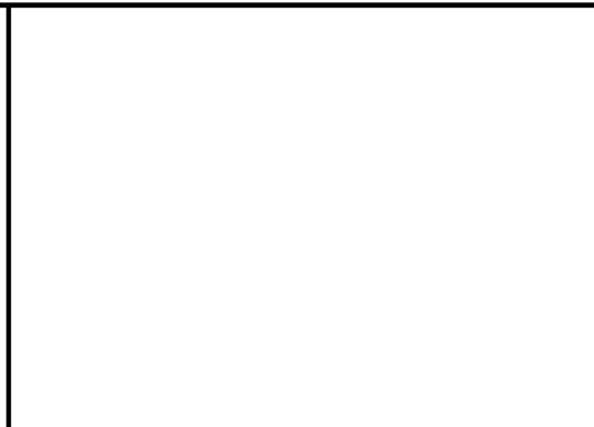
에어컨 냉매 및 전선, 드레인 시공작업시 행거고정 필요