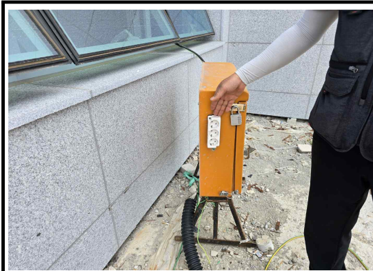
분전반에 부착된 콘센트 방수커버 필요