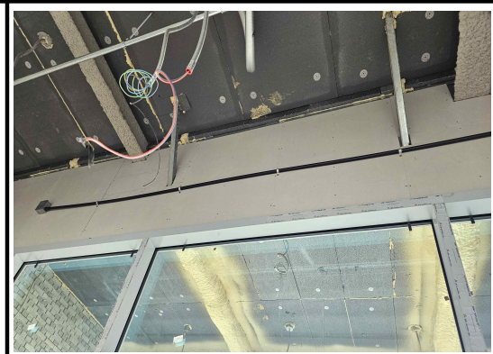
천장 PVC 배관을 후렉시블로 변경