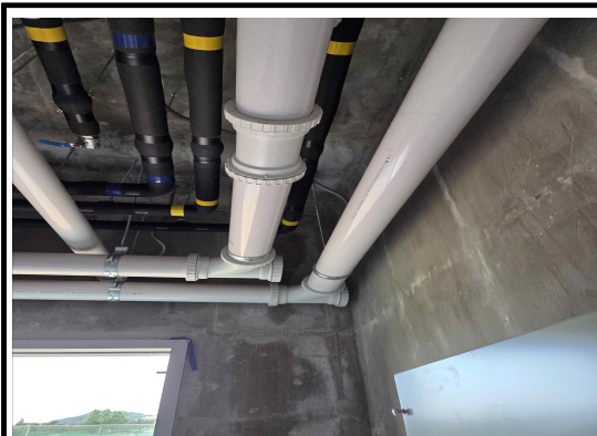
보일러실 상부 배수배관 시공 소재구 공간확보 필요