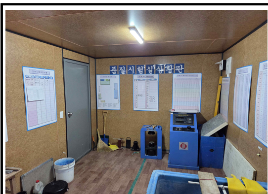
검교정 시험성적서 현황을 출입구에 보완설치 요함