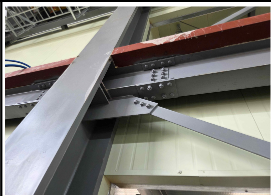
TS볼트 방향 상이한 것 검토필요