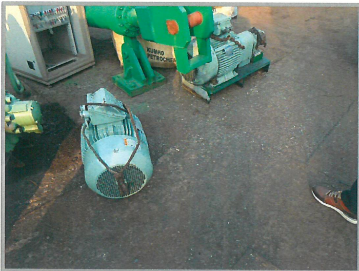
【 유압전동모터 】