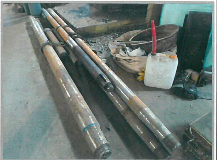
【 축계 】