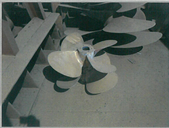
【 프로펠러 】