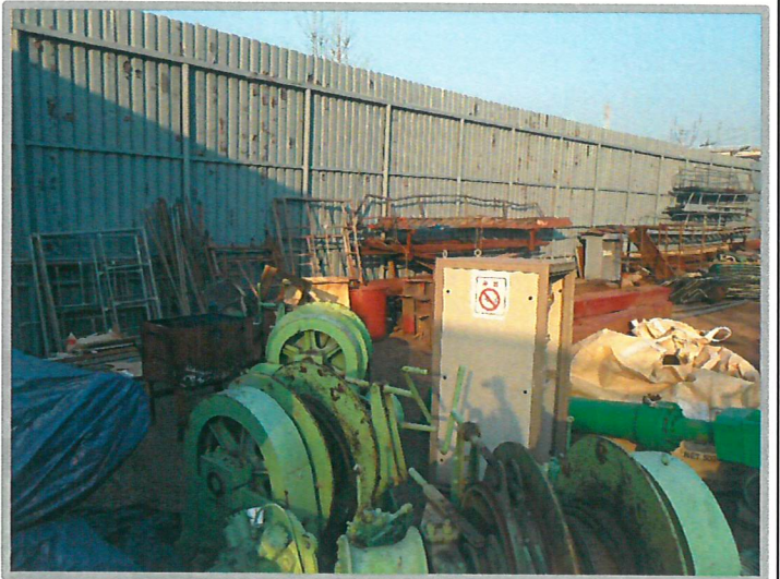
【 원치 】