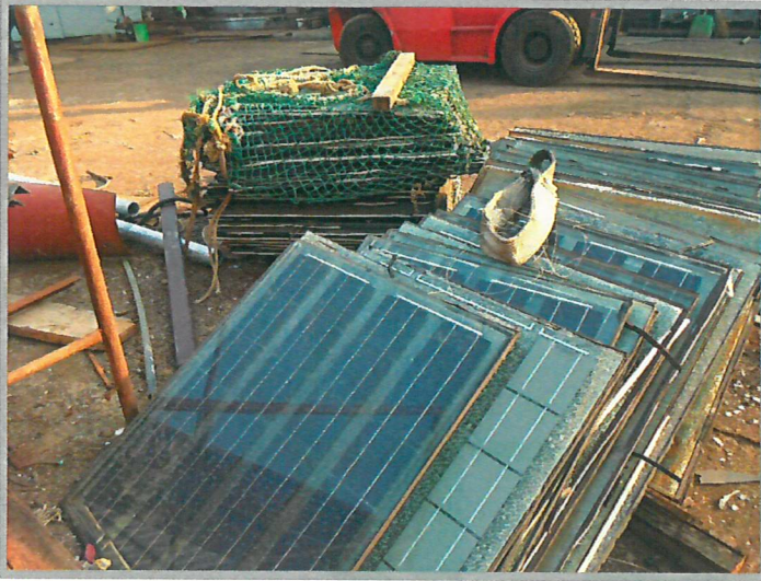
【 태양광부품 】