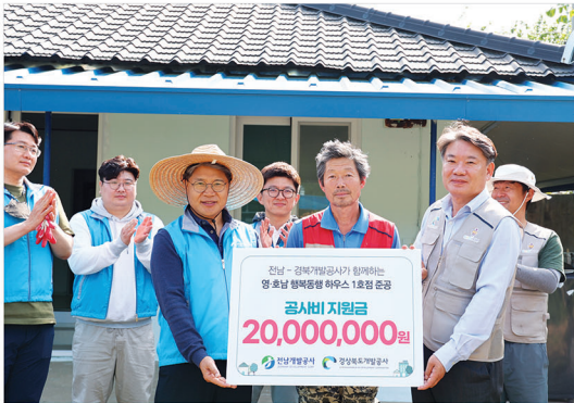
영 호남 협력동행 하우스(1호점)