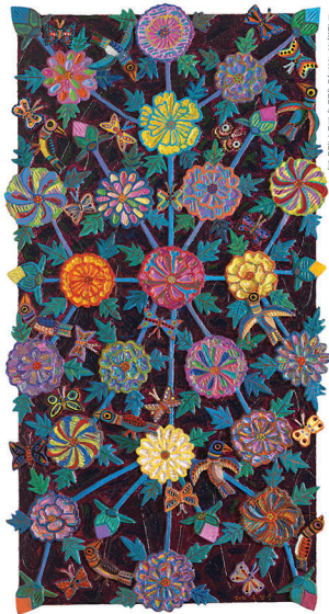
표본용화, 100x100cm, 원단, 크레파스, 양모, 비닐, 양모, 비닐, 비닐, 비닐, 비닐