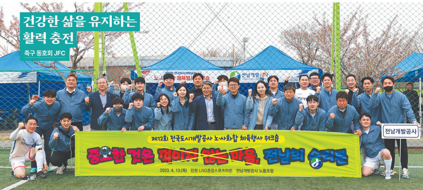
2023. 4. 13.(목) 인천 LNG종합스포츠타운 전남개발공사 노동조합

비쁘게 돌아가는 일상 속에서 건강한 삶을 유지하기 위해 마음이 맞는 사람들과 어울리며 즐기는 일은 유대감과 활력을 준다. 2008년부터 함께 맘 풀리며 추억을 만들어가는 전남개발공사 축구 동아리 JFC를 만나보자.