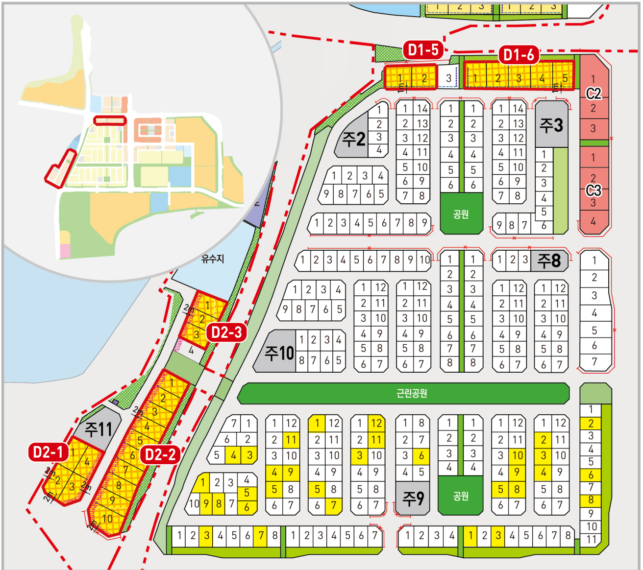
--- 1층벽면지정선 - - - - - 건축한계선 -X-X- 차량출입불허구간 - - - - - 도시개발사업구역계 - - - - - 획지경계선 D1/D2 가구번호 [ ] 가로특화형공지