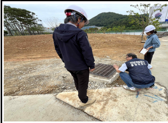
맨홀 돌출구조물 높이 재조정