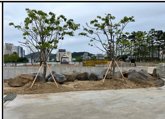
돌의 모양을 잘 파악한 배석으로 경관 향상에 기여, 주변에 초화류나 관목 처리