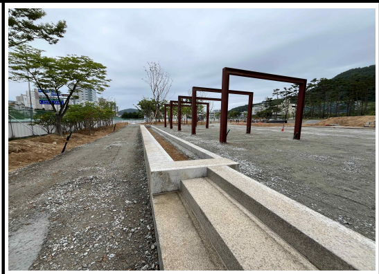
안전을 위해 관목밀식으로 횡단이 어렵도록 처리